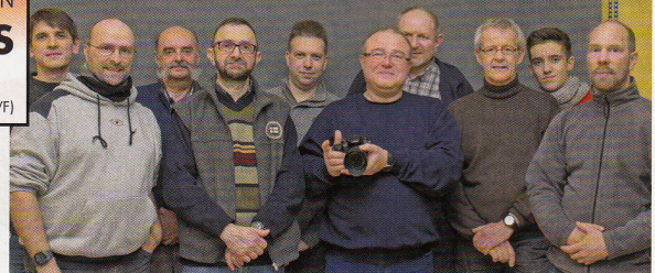
Tester von der Saar: „Es macht Spaß mit der LUMIX GH3 zu fotografieren und zu filmen. Bis in hohe ISO-Bereiche – Qualität: TOP“.

solut starke Ergebnisse. Der automatische Weißabgleich ist bestens, ebenso die unglaublich schnelle Scharfstellung über die Touch-AF-Funktion. Bei Einzelaufnahmen